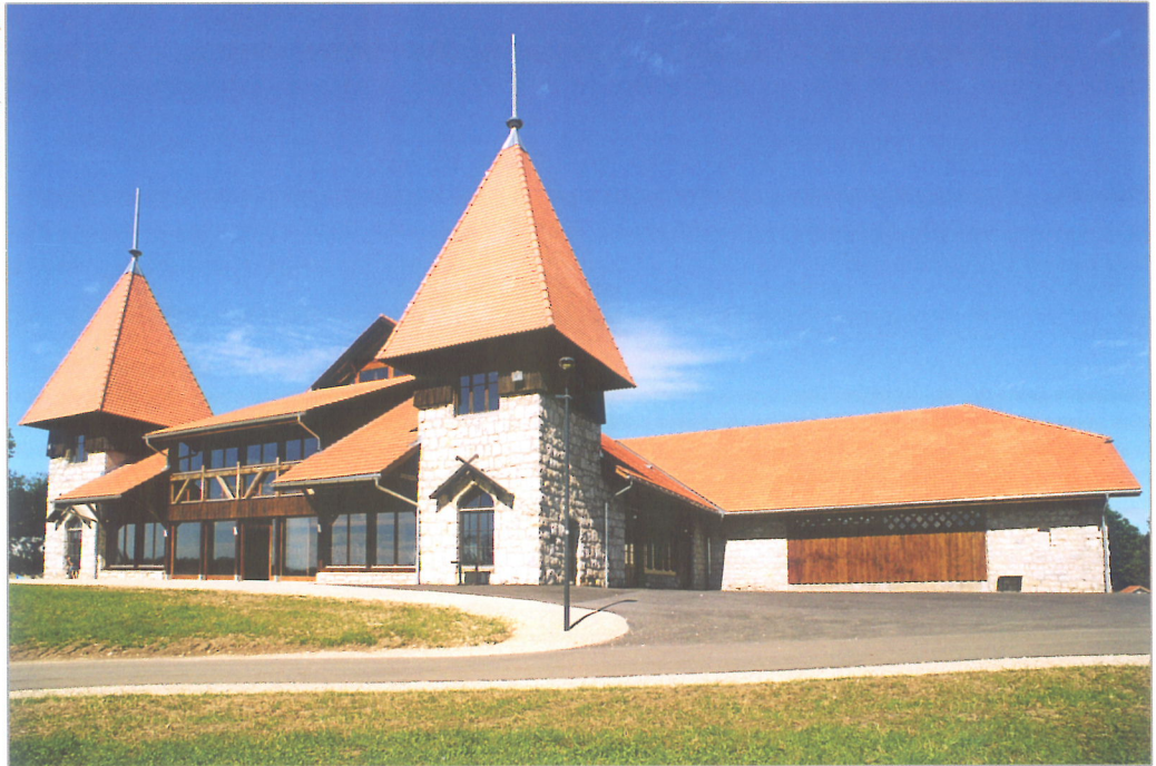
"Halle-Cantine", vue côté Sud

La halle-cantine a une histoire, une histoire de cent ans. Chacun des éléments qui la compose est un témoin : dans le temps et dans l'histoire. Ce projet ne doit pas être considéré comme une chose unique en soi : il doit être vu comme une création inséparable de la vie des habitants de Saignelégier et des Franches-Montagnes. Si la halle-cantine est une réalité concrète, sa mémoire et son histoire sont chargées de valeurs.